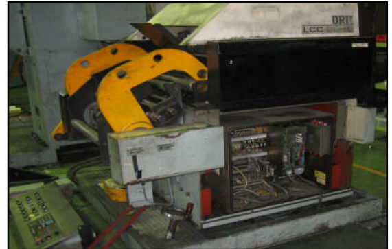
オーバーホール前