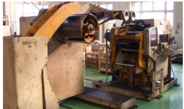
オーバーホール前